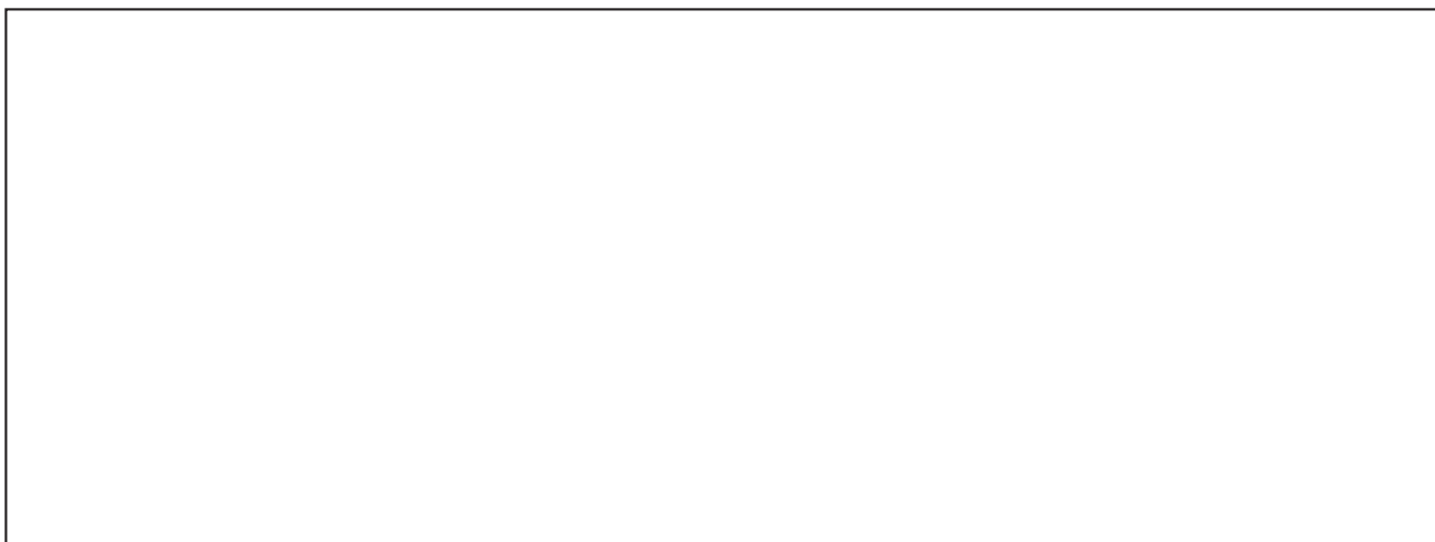
Figura 5. Superficie ocupada por agua en a. escenario hídrico normal y en dos fechas observadas b. 28 de agosto de 2011 y c. 29 de septiembre de 2011.